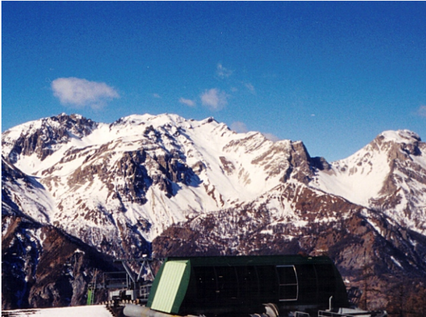
Chalanche Ronde versante Est