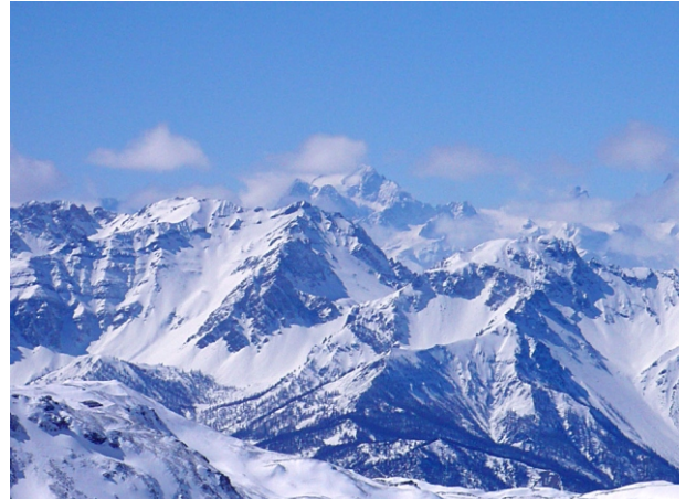
Chalanche Ronde versante Nord- Est