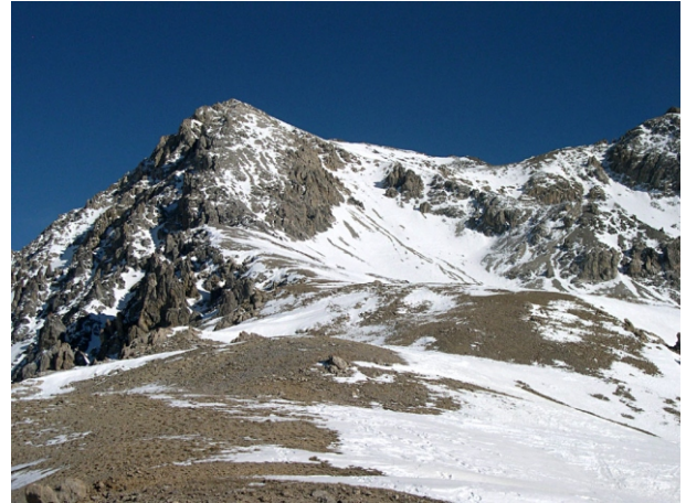
Rocher Charniers versante sud