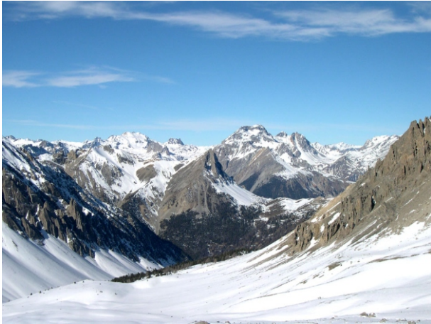
Colle Trois Freaux Mineurs, vista verso nord