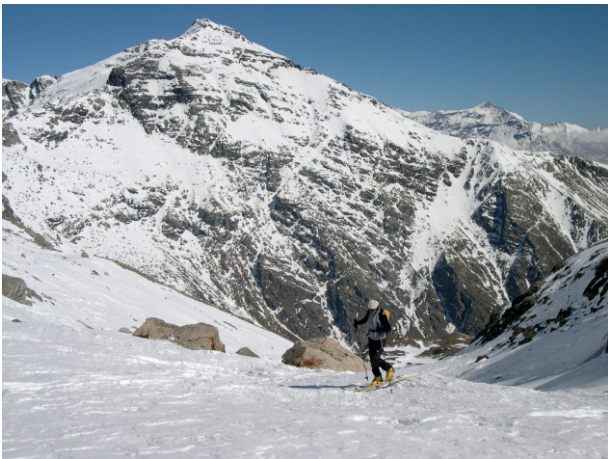
- Salita al Sommeiller vallone di Galambra