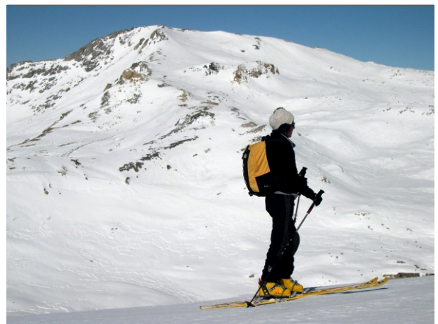
- Sommeiller versante sud